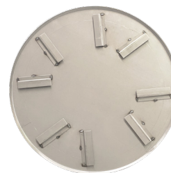
Disco Alisado 36" (no necesita seguro)